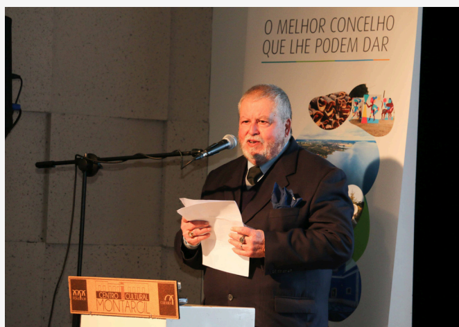
Presidente do MENAC na 3º Congresso da Transparência, no dia 24 de março, em Ponte de Sor.