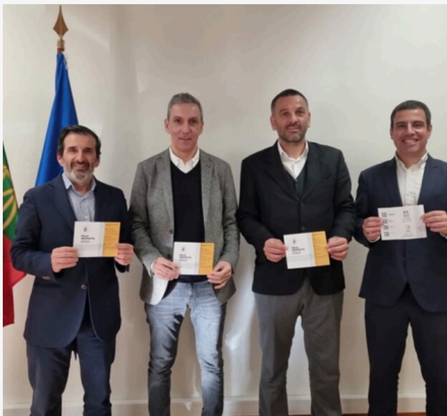
Reunião entre MENAC e COP decorrida em 28 de janeiro.

Realizou-se, no passado dia 28 de janeiro, uma reunião entre o MENAC e o Comité Olímpico de Portugal (COP) com o objetivo de se fazer um ponto de situação em relação ao protocolo de colaboração celebrado entre as duas entidades no passado mês de dezembro. Foi, igualmente, a oportunidade de se proceder à entrega de 1000 dípticos impressos sobre a Integridade no Desporto, uma parceria entre o MENAC e o COP e que agora serão distribuídos pelas diversas federações desportivas. Foram analisadas novas formas de colaboração designadamente envolvendo as escolas e o papel relevante que os jovens terão na mudança de paradigmas comportamentais no que à prevenção dos vários tipos de corrupção diz respeito.