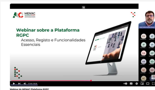
Segunda Edição do webinar sobre a Plataforma RGPC disponível no canal do MENAC no Youtube

O MENAC continuará a promover iniciativas para apoiar as entidades no cumprimento das suas responsabilidades legais.