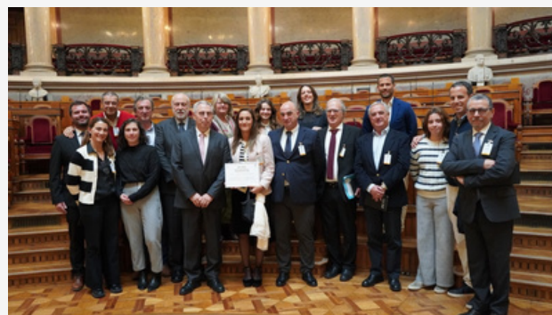
Presidente com MENAC com familiares e amigos de Joana Marques Vidal

O Dia Internacional Contra a Corrupção, celebrado a 9 de dezembro, ficou marcado pela Sessão Comemorativa realizada na Sala do Senado da Assembleia da República, promovida pelo MENAC, que prestou homenagem póstuma a Joana Marques Vidal e a João Cravinho. A iniciativa reuniu mais de 60 convidados, entre familiares, amigos e representantes de entidades institucionais, num momento de elevada solenidade e significado cívico.