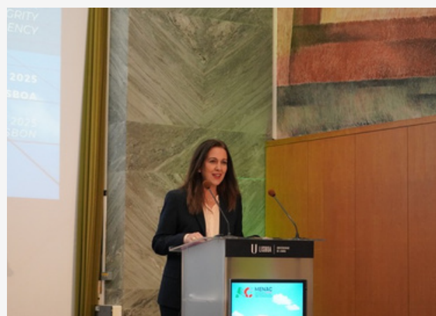
Rita Alarcão Júdice, Ministra da Justiça, na Sessão de Encerramento

Ainda na sessão de abertura, o Procurador-Geral da República salientou que o combate à corrupção não se esgota na criação de instrumentos legislativos ou no reforço de meios, passando também pela adoção responsável de novas ferramentas tecnológicas, nomeadamente a IA. Alertou, contudo, para a necessidade de assegurar que estas soluções são acompanhadas de formação adequada, garantindo que o controlo estratégico e a decisão final permanecem sempre nas mãos do utilizador humano.