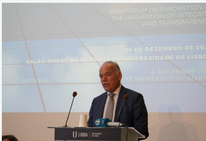
Amadeu Guerra, Procurador-Geral da República, na Sessão de Abertura

Na sessão de encerramento, a Ministra da Justiça reforçou que o combate à corrupção é um desígnio coletivo, sublinhando o compromisso do Governo no reforço das instituições e, em particular, na reestruturação do MENAC. A Ministra destacou que o Mecanismo dispõe agora de uma estrutura estável e capacitada, fruto da redefinição da sua orgânica e do seu modelo de governação, permitindo garantir maior eficácia da sua ação. Enfatizou ainda que a luta contra a corrupção exige avaliação contínua, melhoria permanente e uma implementação consistente da Agenda Anticorrupção, considerando o atual MENAC uma prova concreta de que o caminho traçado é o correto.