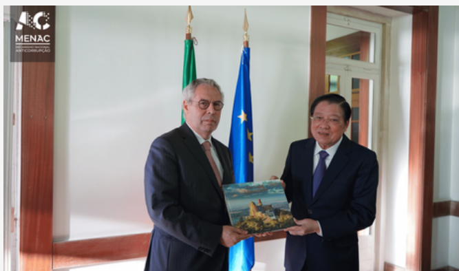
Presidente do MENAC e o Presidente da Comissão de Assuntos Internos do Partido Comunista do Vietname

O MENAC recebeu, no dia 26 de novembro, a visita de uma delegação da República Socialista do Vietname, liderada pelo Membro do Politburo e Presidente da Comissão de Assuntos Internos do Partido Comunista do Vietname, acompanhado pelos Vice-ministros da Justiça e dos Negócios Estrangeiros e pelo Vice-Procurador-Geral.