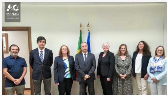
Foto de grupo da reunião bilateral do MENAC com a KNAB da Letónia