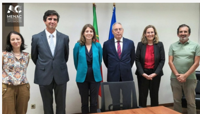
Foto de grupo da reunião bilateral do MENAC com a OGP

No âmbito da Open Government Partnership (OGP), Portugal assumiu, no seu III Plano de Ação Nacional de Administração Aberta (2024-2027), o Compromisso #6 – “Programa de capacitação e divulgação do Regime Geral de Prevenção da Corrupção (RGPC)”.